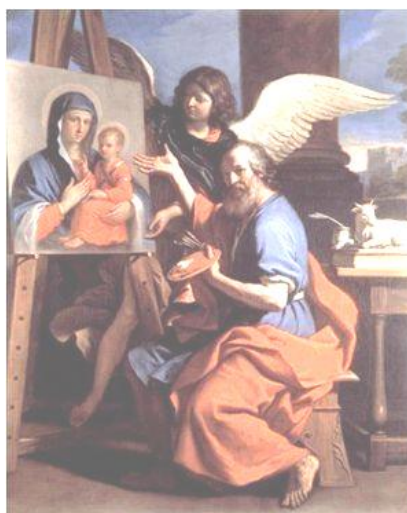
San Luca – Guercino – ca 1562